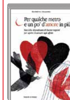
Edizioni Ristretti, 2017 pag. 416, 15 euro

Per informazioni riguardanti i progetti di Ristretti Orizzonti e il servizio abbonamenti, chiamare dal lunedì al giovedì dalle 8:30 alle 17:00 il numero telefonico – +39 340 745 1026