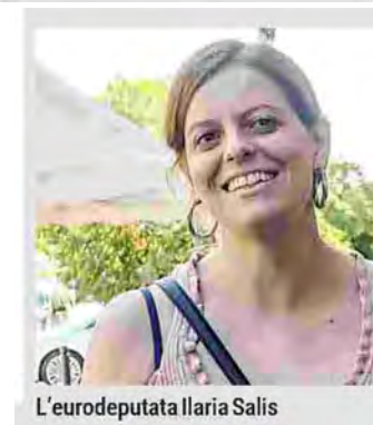
L'eurodeputata Ilaria Salis

Sul giornale di domenica abbiamo pubblicato la lettera delle detenute del carcere di Torino che sarebbero pronte a fare lo sciopero della fame per protestare contro il sovraffollamento che rende insopportabile la loro detenzione in carcere