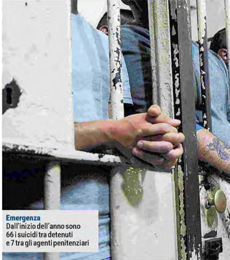
Emergenza Dall'inizio dell'anno sono 66 i suicidi tra detenuti e 7 tra gli agenti penitenziari

Il 3 agosto, sempre a Torino ma al carcere minorile Ferrante Aporti, è scoppiata una rivolta che si è tradotta nella devastazione di buona parte della struttura