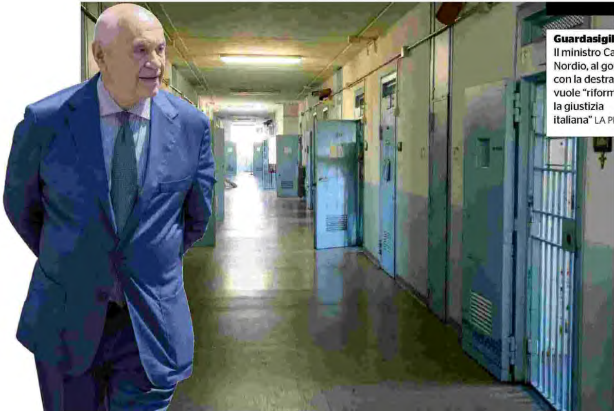
Guardasigilli Il ministro Carlo Nordio, al governo con la destra, vuole "riformare la giustizia italiana"