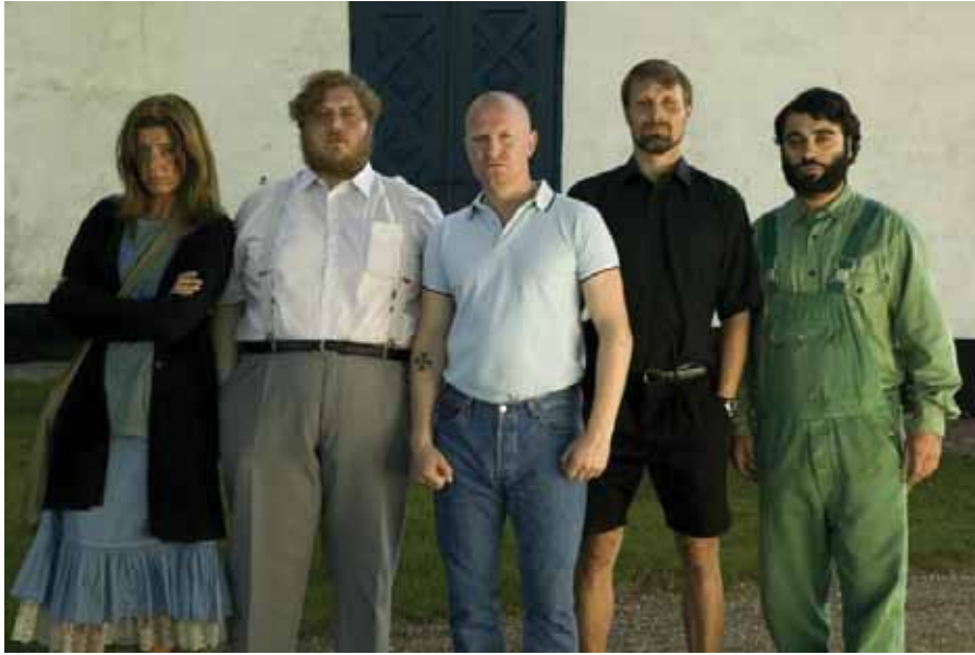
una scena coi protagonisti del film