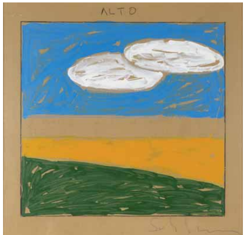
Mario Schifano - Paesaggio anemico