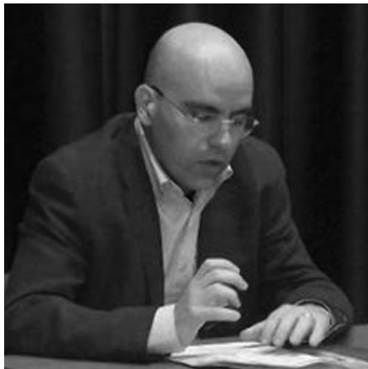
Ettore Picardi, Sostituto Procuratore

Tuttavia quelle che possono risolvere davvero il problema sono misure di riforma definitiva e sistemica. Certo vi sono emergenze di edilizia penitenziaria che non possono essere dimenticate, con le difficoltà di spesa pubblica oggi presenti. Ed andranno affrontate e risolte con la costruzione di nuovi edifici: sarà una spesa ma anche un'occasione produttiva. Quello che però davvero può migliorare in modo stabile la situazione sarà un mutamento della cultura della pena, della sua concezione. Passare dal mito del carcere come unico e massimo deterrente, buono per ogni stagione e forma di delitto, ad un sistema più equilibrato e ragionevole. Un sistema che punti a dei risultati pratici, ragionevoli. Il carcere dovrebbe essere riservato a coloro che sono autori di condotte così allarmanti da giustificare la loro separazione personale dal contesto sociale. Negli altri casi occorreranno sanzioni dirette a riparare o prevenire altri delitti, seguendo la