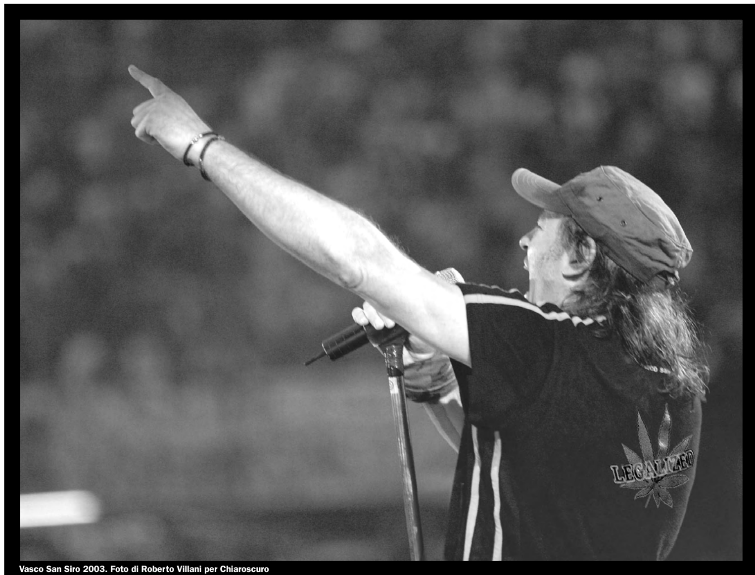
Vasco San Siro 2003.